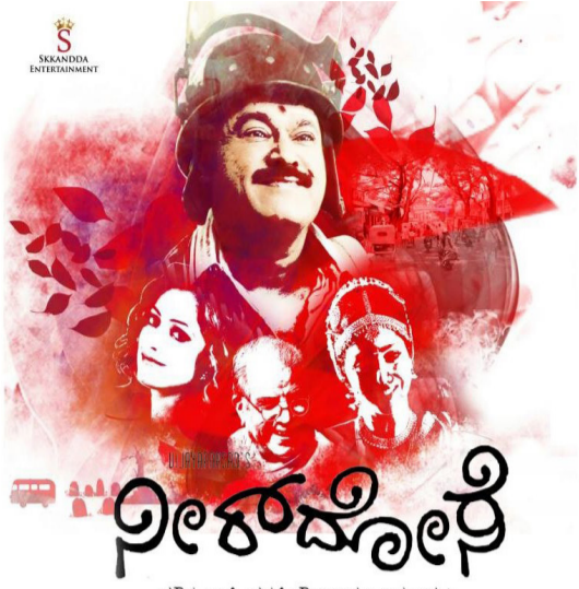
ಮೌನ, ತಾಳ್ಮೆ, ಸಹನೆ ದೌರ್ಬಲ್ಯವಲ್ಲ, ಅವು ಅಸ್ತೆ !!

ಭಯಂಕರ ಡಬಲ್ ಮೀನಿಂಗ್ ಚಿತ್ರ ನೀರ್ ದೋಸೆ ಖಡಕ್ ಡೈಲಾಗ್‌ಗಳ ಸರಮಾಲೆಯೇ ನೀರ್ ರೊಟ್ಟಿಯಾಗಿ ಅಜೀರ್ಣವಾದರೂ, ದೋಸೆ, ಎಲ್ಲಾ ತರಹದ ಪ್ರೇಕ್ಷಕರ ಮೆಚ್ಚುಗೆ ಗಳಿಸಿದೆ. ಜಗ್ಗೇಶ್ ಅವರ ಡೈಲಾಗ್ ಡೆಲಿವರಿ, ಮುಖಭಾವ, ಹರಿಪ್ರಿಯ ಅವರ ಬೋಲ್ಡ್ ನಟನೆ